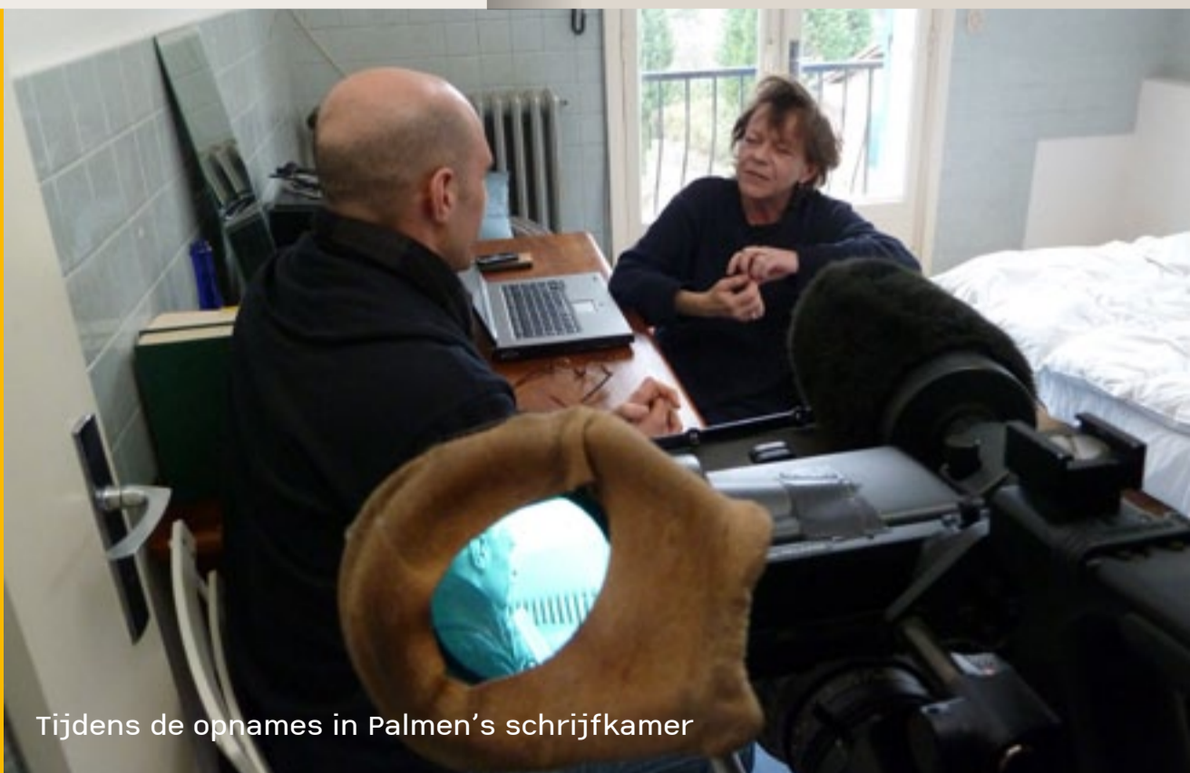
Tijdens de opnames in Palmen's schrijfkamer

"Ik herinner me het geluk. Het was zo groot dat het pijn deed."