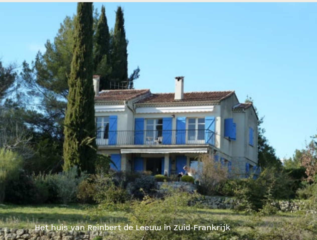
Het huis van Reinbert de Leeuw in Zuid-Frankrijk

Connie Palmen (25 november 1955) schreef vier romans, vier essaybundels en een novelle. Ze bundelde haar interviews in God en vitriool en haar verspreide werk in Als een weke krijger . Met deze boeken behoort zij tot de belangrijkste Nederlandse schrijvers van deze tijd. Zowel in haar romans als in haar beschouwingen ontvouwen zich haar briljante stijl en heldere redeneertrant.